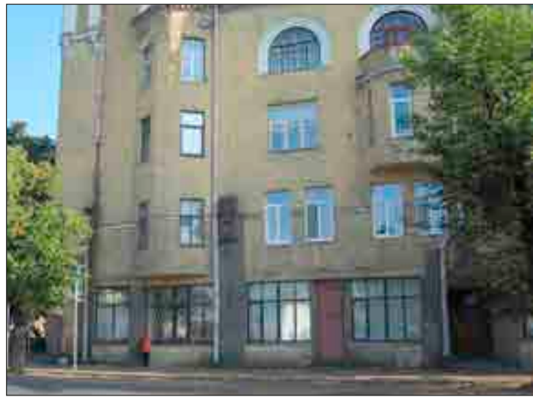
"Pietinenska palatset" i dag.

uniformer än soldaterna. Restaurangen var öppen dygnet runt varje dag. Stamgästerna var beväpnade med sablar och pistoler och utrustade med