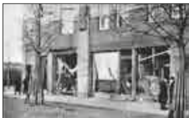
Fasaden år 1918.

uniformer än soldaterna. Restaurangen var öppen dygnet runt varje dag. Stamgästerna var beväpnade med sablar och pistoler och utrustade med