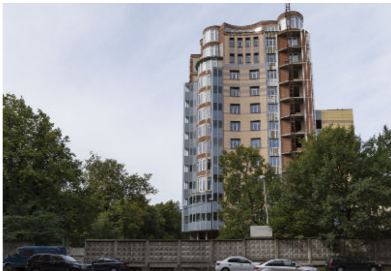
Det ryska nybygget bakom planket.