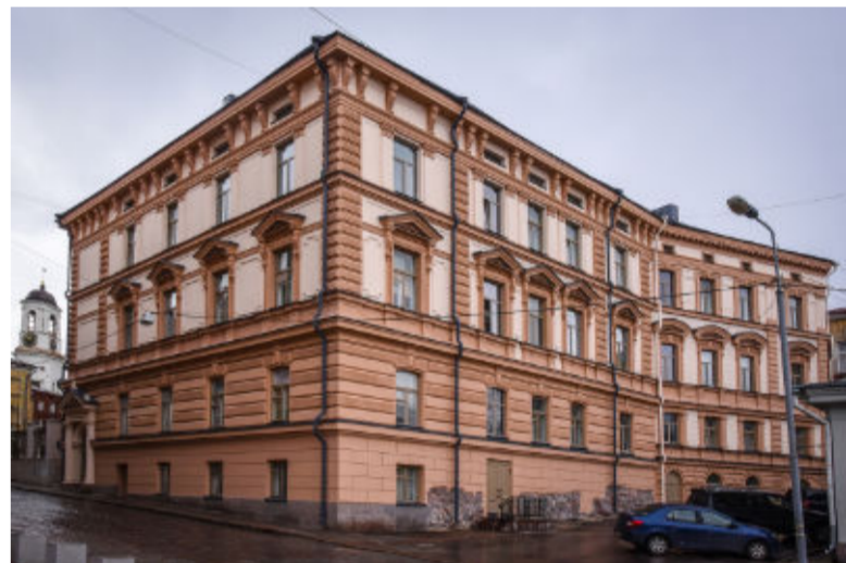
Wolffska huset i april 2020.