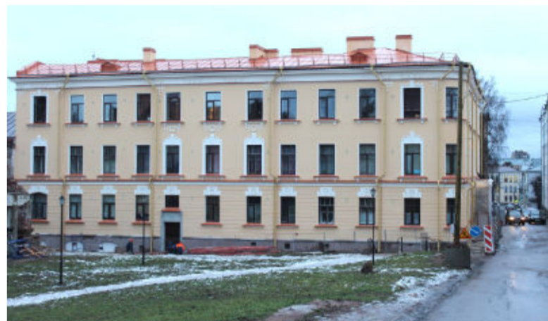
Cloubergs hus i januari 2020.

Det finns också andra hus som renoverades men de ovannämnda har blivit de mest lyckade.