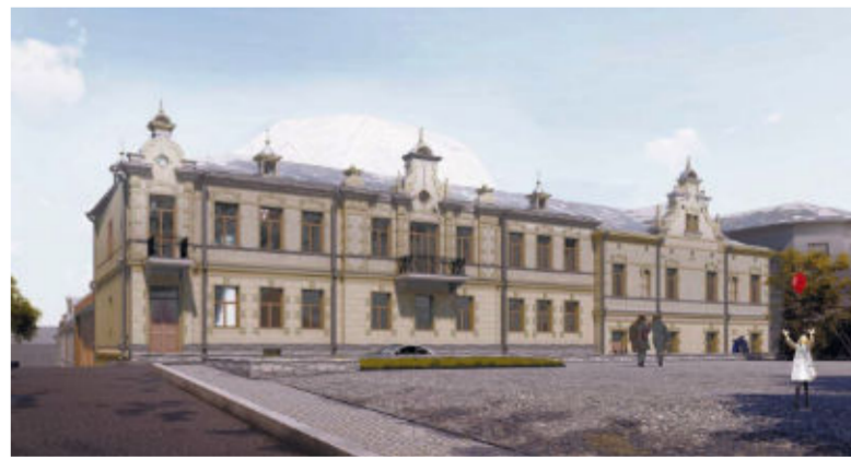
Seth Sohlbergs kvarter från Vaktornsgatan.

terscen, utställningslokaler och uthyrningslokaler för affärer, kaféer osv. Dessutom skall det gamla apoteket på Katarinegatan och byggnader som ligger mittemot renoveras. Byggnadsarbetena kommer att fortsätta åtminstone fram till 2025.