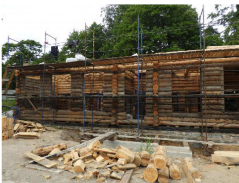
Biblioteksflygelns återuppbyggnad sommaren 2020.

Både huvudbyggnaden och biblioteksflygeln skall efter återuppbyggnaden bli museala utställningsutrymmen, planeringen av deras kommande innehåll pågår. Interiörerna skall restaureras, men av möbler och konstverk finns just ingenting autentiskt att ställa ut – utom två vackra kommoder från 1700-talet, som donerades till Monrepos redan 1990 av Peter von der Pahlen, son till den siste finske ägaren. I september 2020 har man publicerat en liten katalog över valda nummer ur de museala samlingarna på Monrepos i dag.