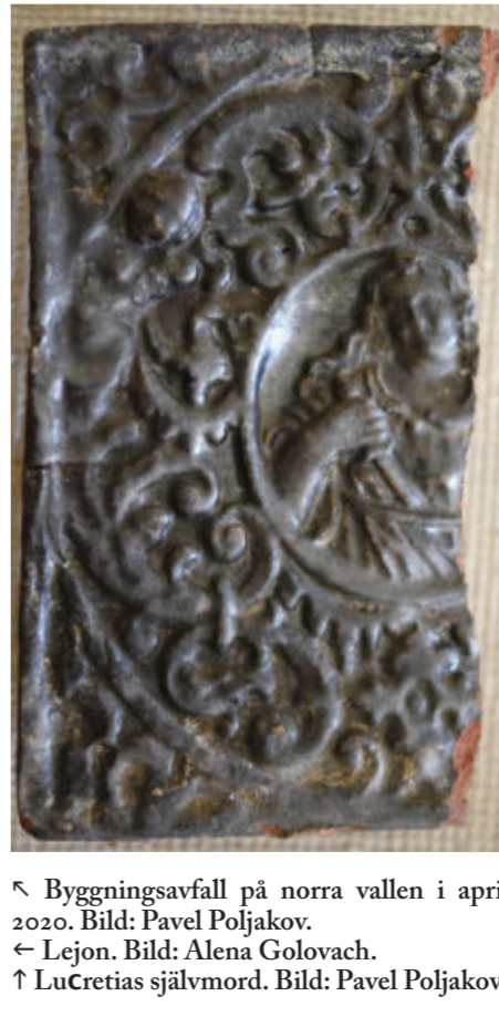
↖ Byggnadsavfall på norra vallen i april 2020. Bild: Pavel Poljakov. ← Lejon. Bild: Alena Golovach. ↑ Lucretias självbild. Bild: Pavel Poljakov.